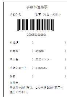
（手数料連絡票の例）