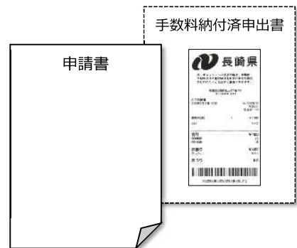
（提出時のイメージ）