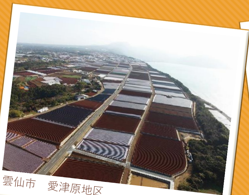
雲仙市 愛津原地区